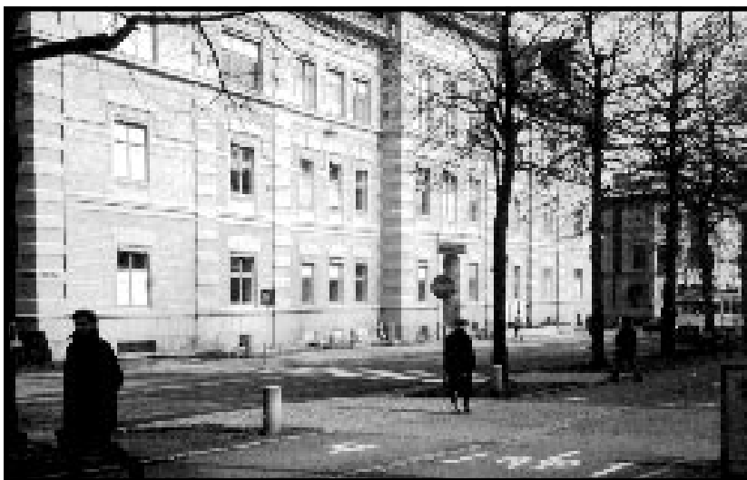
Konsthögskolan Valand