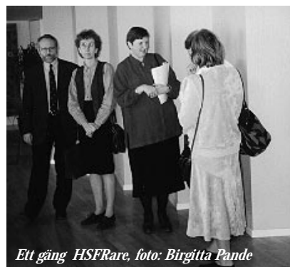
Ett gäng HSFRare