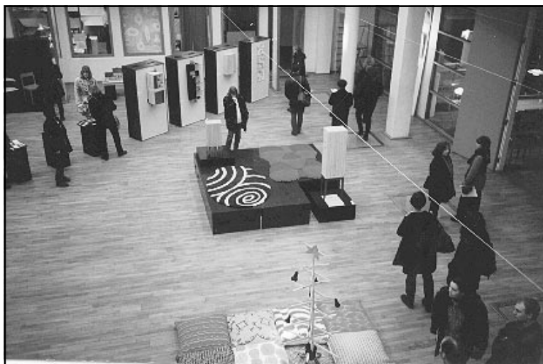
Öppet hus på HDK, foto: Birgitta Pande

Lördagen den 25 januari hade Högskolan för design och konsthantverk, HDK, på Kristinelundsgatan öppet hus för såväl universitetsanställda som allmänhet. Högskolan tillhör sedan 1977 Göteborgs universitet och har cirka 250 studenter. I designprogrammet ingår: grafisk design, inredningsarkitektur, industridesign, produktdesign. I konsthantverksprogrammet ingår keramikkonst, smyckekonst och silversmide samt textilkonst. Examensbenämningarna är konstnärlig högskoleexamen med inriktning på design- och formgivningområdet och konstnärlig högskoleexamen med inriktning på konsthantverk. HDK har ett väl utbyggt samarbete med design- och konsthantverksutbildningar i Europa och genom Nordplus-, Erasmus- samt Sokratesprogrammen finns möjlighet att förlägga viss del av studietiden utomlands. Det förekommer också en del student- och lärarutbyten. För att komma in på de eftersökta utbildningsplatserna på HDK krävs allmän behörighet men man måste också genom arbetsprover bevisa sina konstnärliga förutsättningar. De som antas till HDK har ofta gått en förberedande konstnärlig utbildning. Mer information om utbildningen, tel 031-773 48 80.