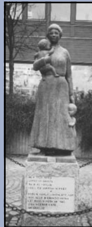
Med fast hand sträv av arbete mjuk av kärlek håll du samman hemmet Staty vid Landala Torg, skulptör: Elma Oijens

- Du skall veta att du är något - - - och du skall veta att du är en som behövs!