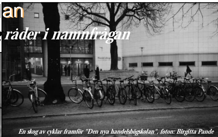
En skog av cyklar framför "Den nya handelshögskolan"