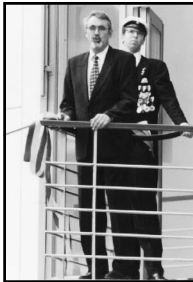
T. h Handelshögskolan, korsningen Vasagatan - Sprängkullsgatan, t. v. Percy Barnevik invigningstalar