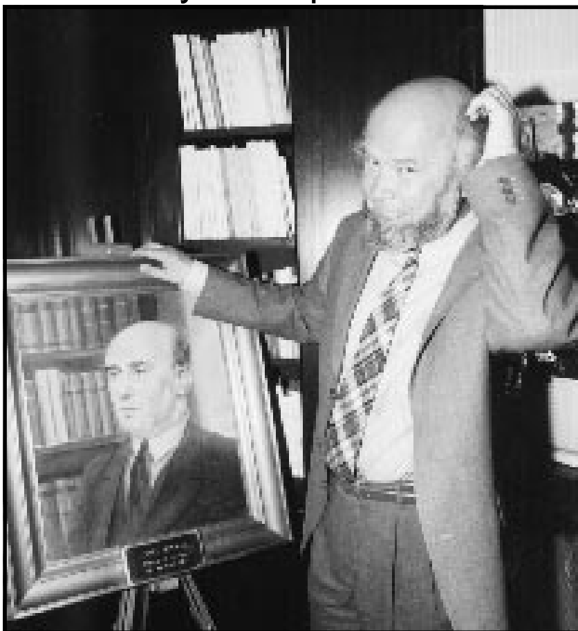
Pristagaren framför porträtt av donatorn.