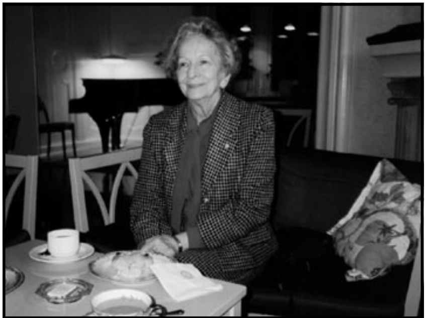
Wislawa Szymborska