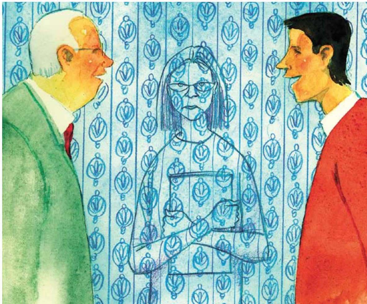
ILLUSTRATION: TOMAS KANLSSON

Anna var en glad nybliven doktorand och ville inte bråka. Trots att hennes manliga kollegor fick andra villkor och orättvisorna blev allt tydligare så jobbade hon på. Det tog månader innan hon till slut protesterade. Då blev det ett himla liv.