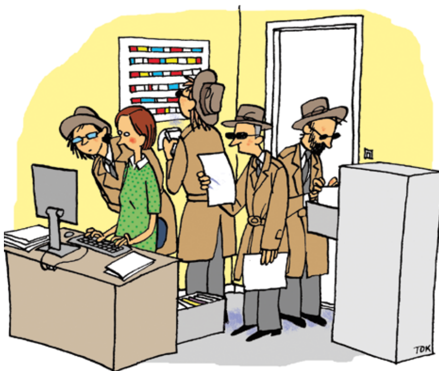
ILLUSTRATION: TOMAS KARLSSON

För mer information: http://www.gu.se/kvalitet/