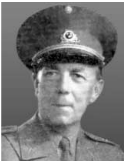
Folke Bernadotte - kontroversiell?