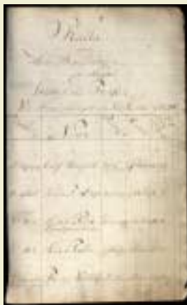
Rulla för skeppet Gustaf den tredje 1791.