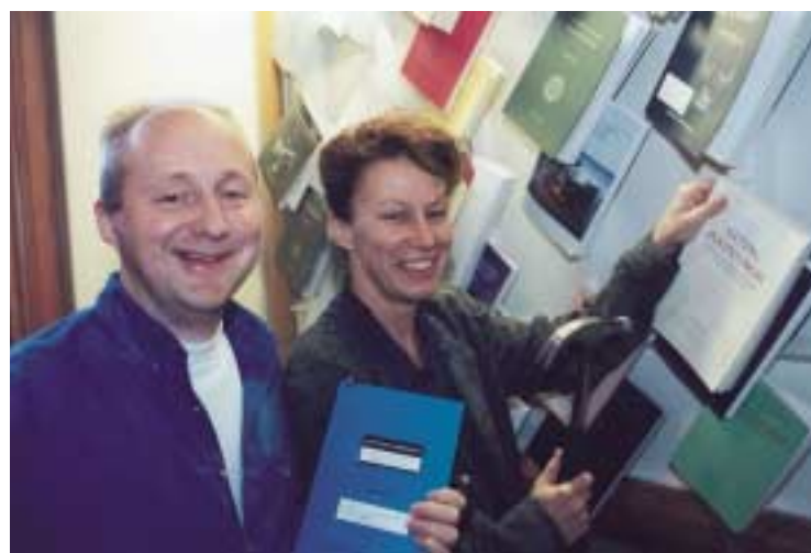
Spikat och klart!

Att doktorera samtidigt och ha barn har inte slitit på förhållandet och de har delat på föräldradedigheten.