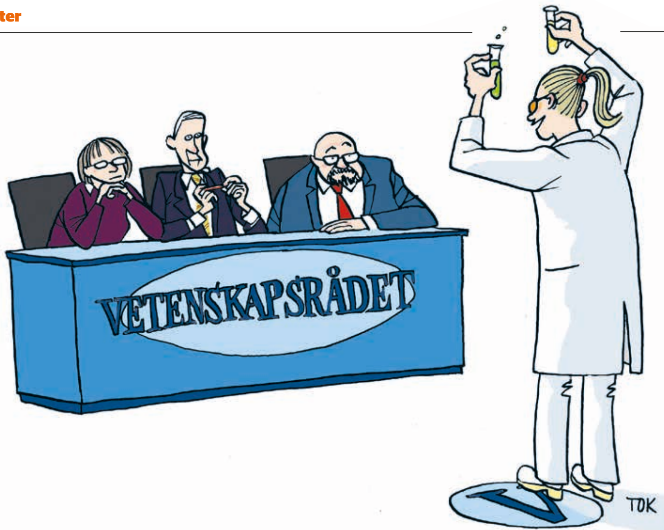
ILLUSTRATION: TOMAS KARLSSON