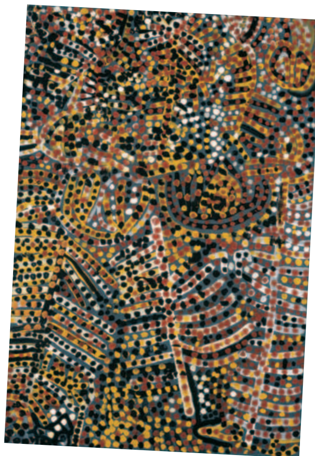
Emily Kame Kngwarreye, Emu Woman, 1988–1989. Akrylfärg på duk, 92,0 x 61,0 cm