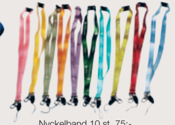
Nyckelband 10 st 75:-