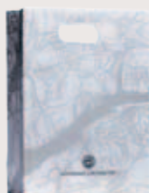
Liten presentpåse 12:-