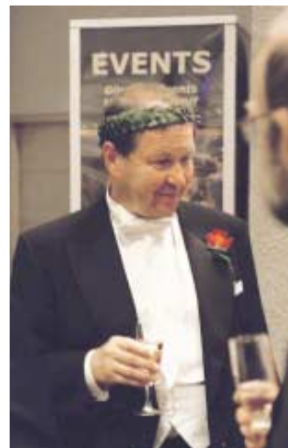
Filmregissören Roy Andersson blir hedersdoktor vid konstnärliga fakulteten.

ner jag mig lite bunden av en viss lojalitet gentemot Göteborg, en känslomässig bindning.