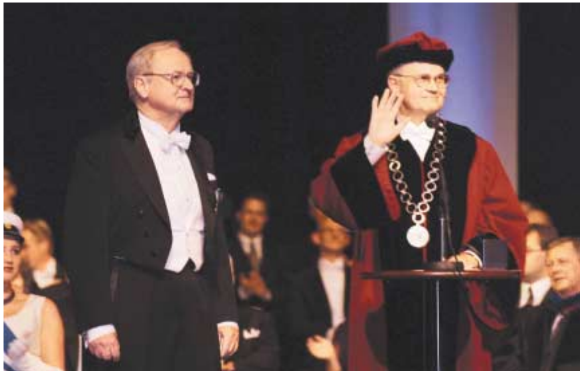
Stående ovationer. Applåderna ville aldrig ta slut när nobelpristagaren Arvid Carlsson gick upp för att ta emot utdelningen Socii et Amici.