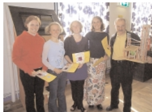
Fyra tjejer från naturvetenskaplig problemlösning tog hem Experimentums årliga tävling för studenter.

Årets tävlingsbidrag kan man se i Experimentums utställningshall i åtminstone ett år framåt.