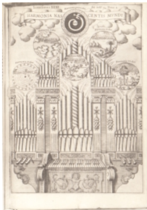
"Världsgorgeln" som symbol för skapelsen och kosmos - sfärernas harmoni i 1600-tals filosofen Athanasius Kirchers tappning (Musurgia Universalis, 1650)