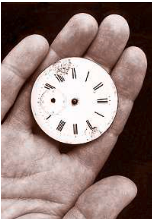
Text: Ina Langsberg