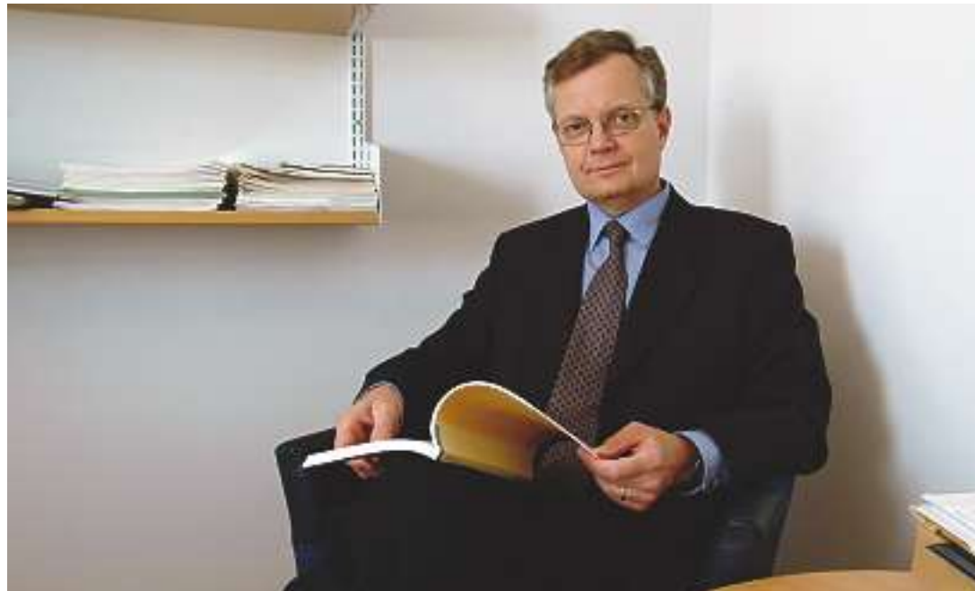
Genom mångfalden har GU förutsättningar att bli intressantare än andra universitet.

Däremot skulle institutioner, anställda och studen-