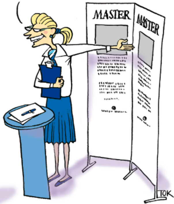
ILLUSTRATION TOMAS KARLSSON

JÄ, DET HAR BLIVIT VÄLDIGT POPULÄRT OCH VI HAR INTE MÅNGA PLATSER KVÄR. MEN OM DU SÖKER IDAG, SÅ FÅR DU EN BONUS PÅ 25 POÄNG!