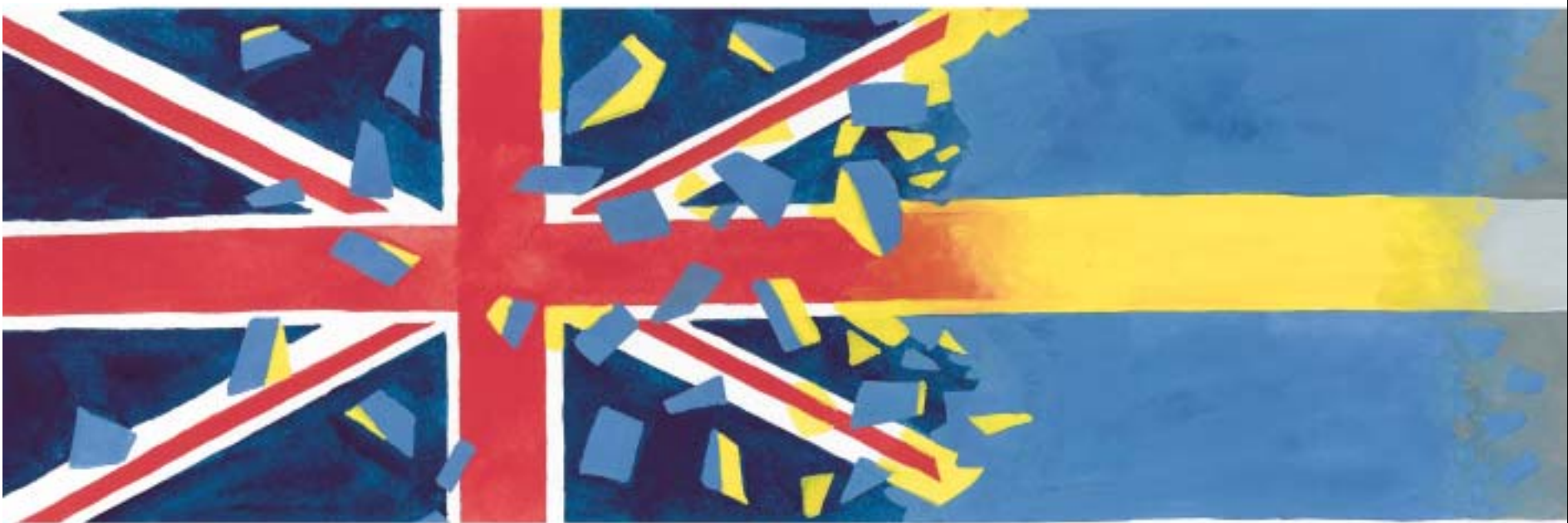
ILLUSTRATION: TOMAS KARLSSON