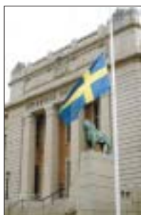
Tre tysta minuter för offren i USA