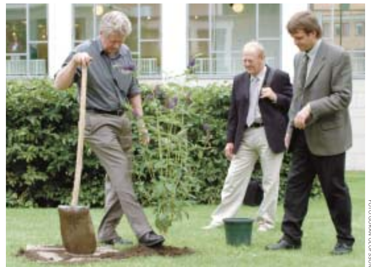
Miljöminister Kjell Larsson planterar en fjärilsbuske som en påminnelse om alla de fjärilsarter som är utrotningshotade i Europa.

– Utbildningen är unik, berättade Kjell Larsson. Studenterna läser tillsammans med naturvetare och får kunskaper om både samhälle och miljö, samtidigt som de lär sig att arbeta i nätverk och projekt. Det är en utbildning jag själv skulle ha valt om jag varit ung i dag.