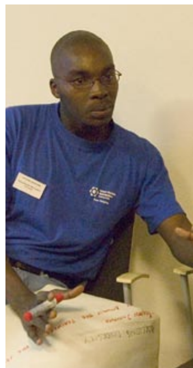
Studenterna diskuterar olika roller.