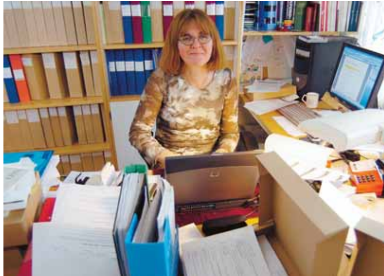
Dokumentation är a och o för forskare. SSD erbjuder en möjlighet att samla in och sprida data i hela världen.

Vilka studier har gjorts om dödsor-saker i södra Sverige? Och vem har undersökt biståndsviljan i Uruguay på 60-talet?