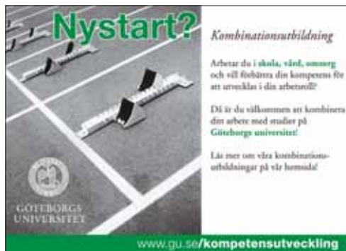
Annonssom syns i västsvenska dagstidningar under juli-augusti.

för utbildning är ofrivilligt halvtidsanställda inom skola, vård eller omsorg. Det är arbetsgivaren som identifierar de personer som behöver öka sin kompetens och som anmäler till CSN. Studenten får 3 800 kronor per studiemånad. Lärosätet får motsvarande 86 000 per helårsstudent.