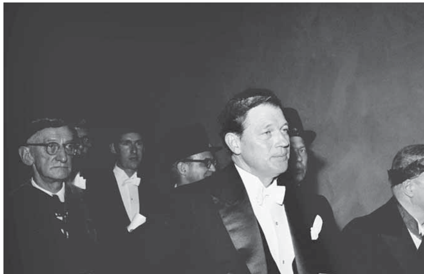
När Harry Martinson återvänder till Göteborg 1954 är det som hedersdoktor och inte som uteliggare.

På dagarna besöker han bibliotek och boklädar, bland annat Eckersteins bokhandel i hörnet mellan Södra Allégatan och Sprängkullsgatan. Men han ser ut som en tiggare och en dag blir han bort-