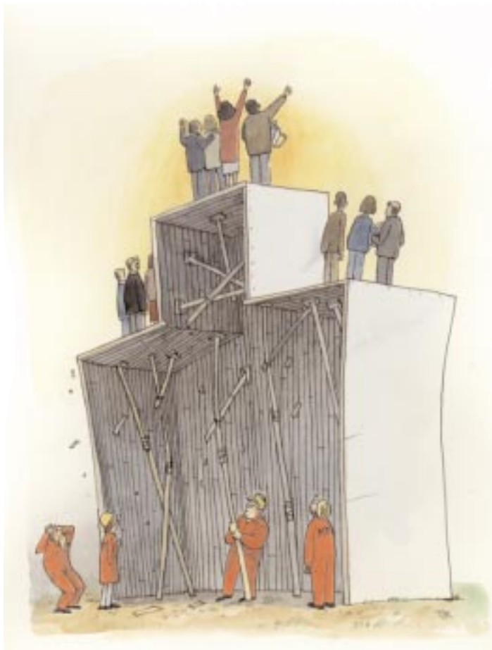
ILLUSTRATION: TOMAS KARLSSON

Etta i landet på tyska och idéhistoria. Trea totalt.