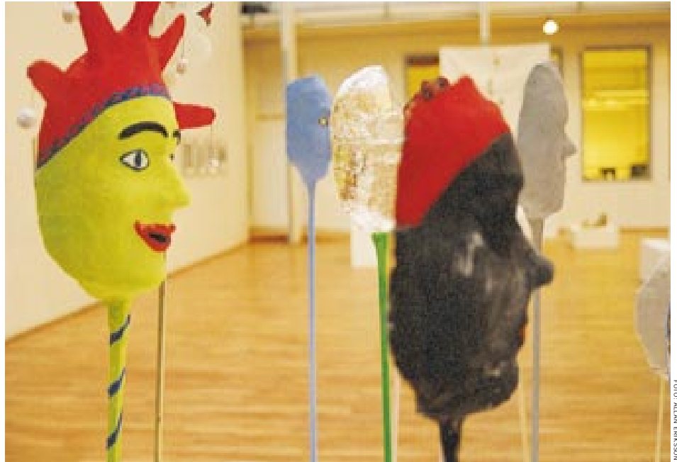
Studenterna på HDK har fått i uppdrag att göra masker som visar motsatsen till dem själva.