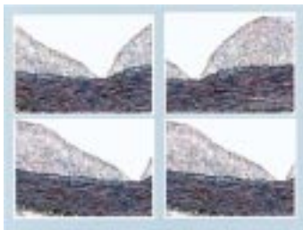
Här ser vi några exempel på förkalkade ådror.

Den avancerade forskningen vid laboratoriet har gett det ett högt internationellt renommé. Dagens sju for-