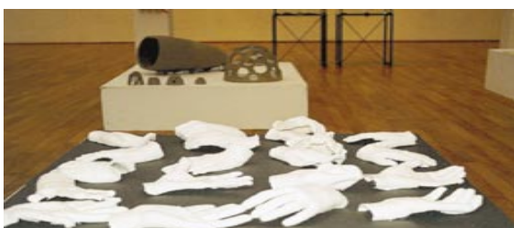
Händer i gips var en fri uppgift i projektet.