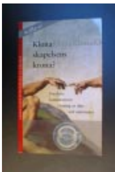
"Klona skapelsens krona?" Forskare kommenterar kloning av djur och människor. FRN-källa 49. 1997.