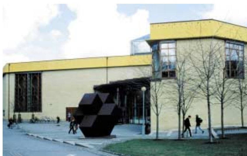
Högskolan för teater, opera och musikal kan inte räkna med ökade resurser trots stort behov.

– Exempelvis hade man kanske kunnat begära fem utbildningsplatser till. I ett läge där intresset för universitetsstudier