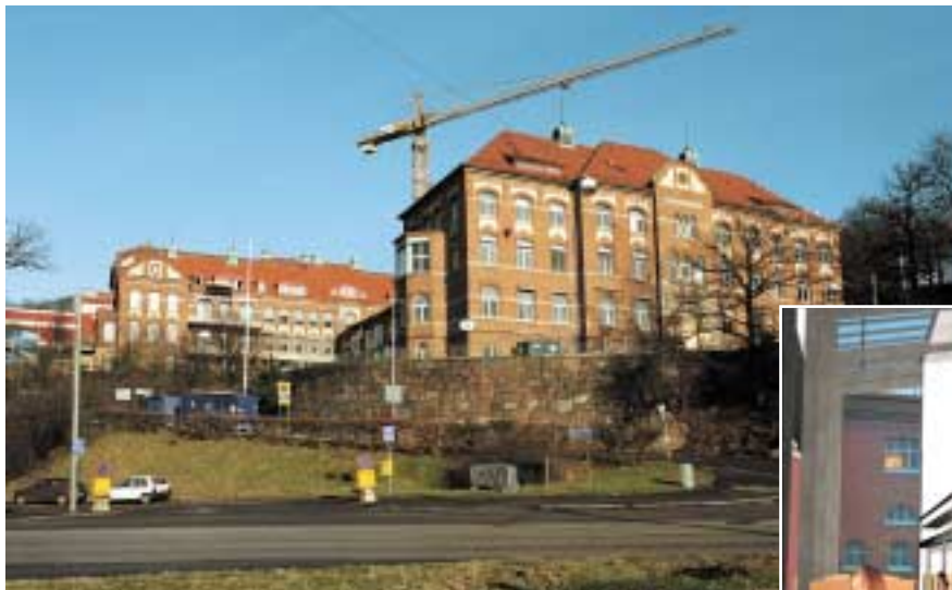
Ett inglasat hus kommer att rymma bibliotek, läsesalar, café och seminarierum och via en gångbro kommer Annedalskliniken att förbindas med Medicinarberget.