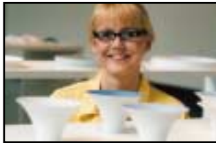
Att samla är också att konsumera s 7