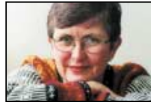
Trist med enkönad debatt s 13