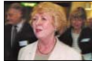
Språk är kultur s 16-17