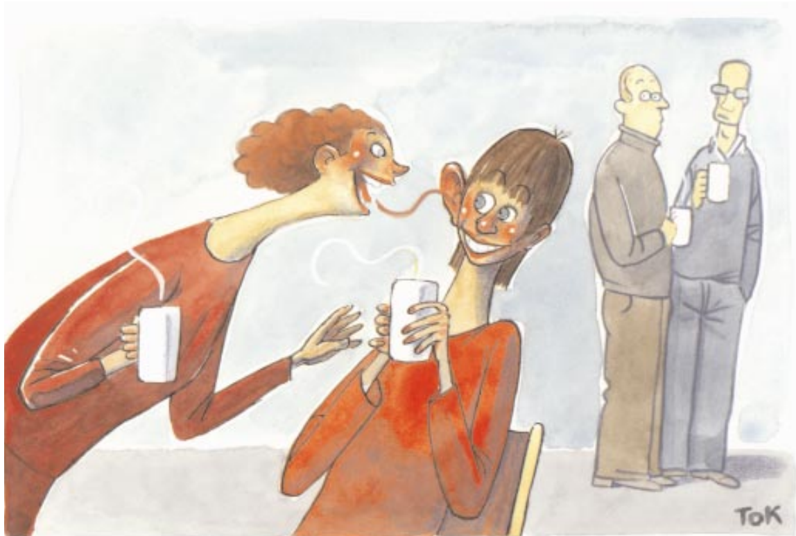
ILLUSTRATION: TOMAS KARLSSON