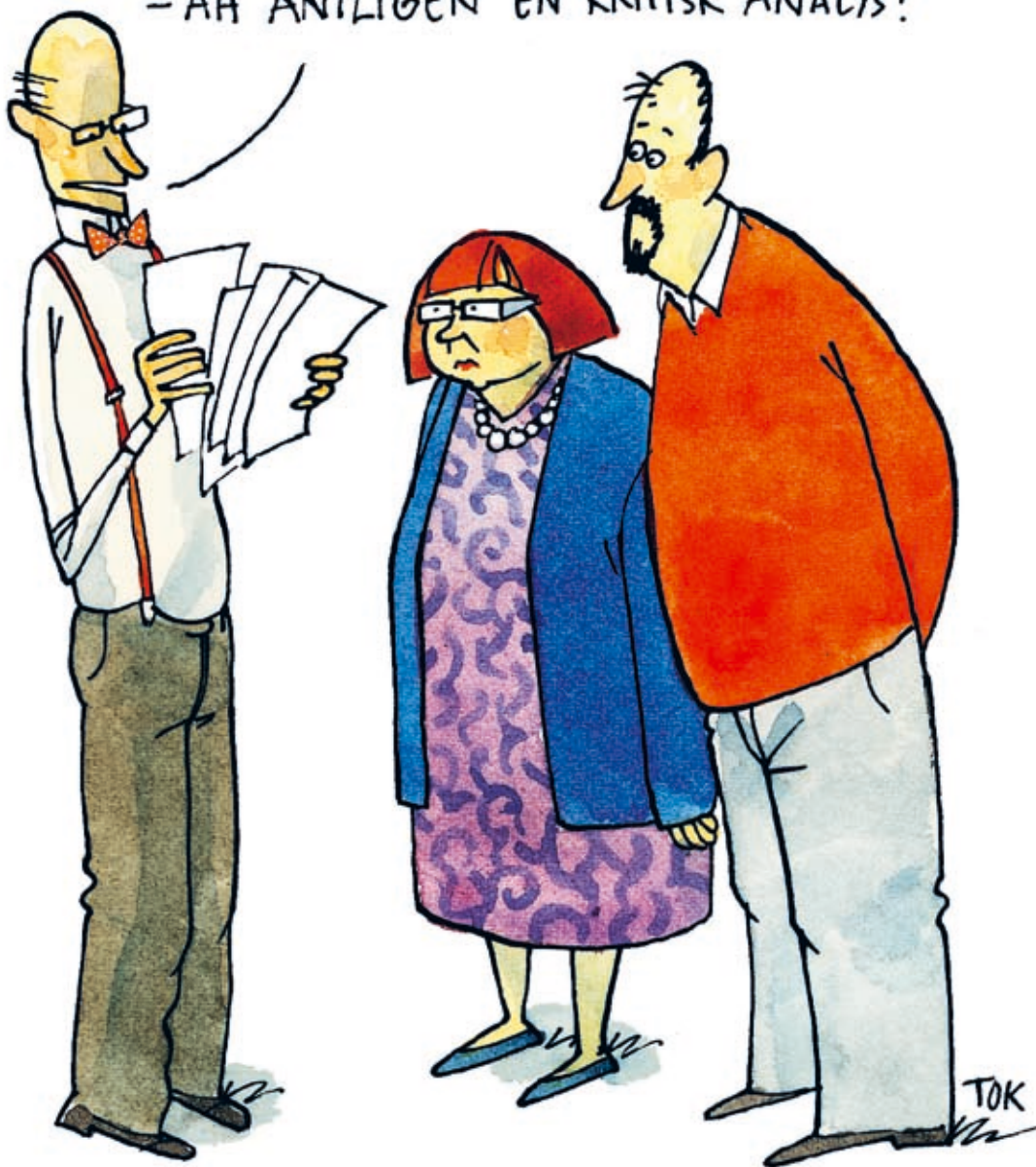
ILLUSTRATION: TOMAS KARLSSON

JAG MISSTÄNKER ATT VI FÅTT ETT SVÅRT FALL AV KOPIERING. SÅ HÄR SVARAR STUDENTERNA PÅ FRÅGA FEM: "FÖRSTÅR INTE FRÅGAN", "FÖRSTÅR INTE FRÅGAN", "FÖRSTÅR INTE FRÅGAN", "FÖRSTÅR INTE FRÅGAN" ... EH, "KORKAD IDIOTFRÅGA" - AH ÄNTLIGEN EN KRITISK ANALYS!