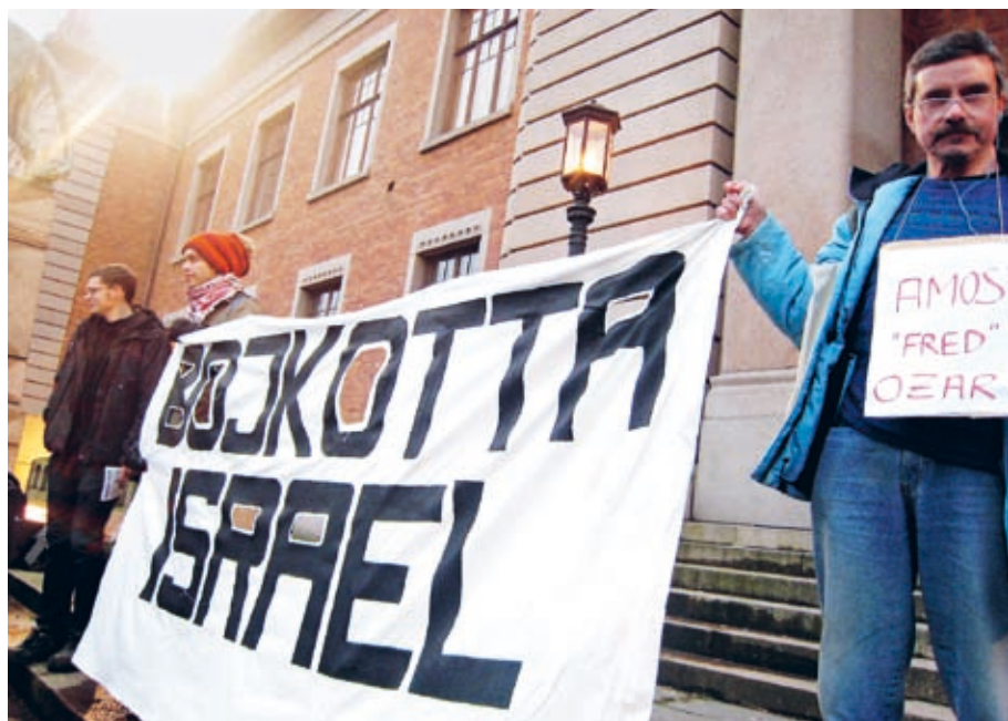
Det krävdes en biljett för att lyssna på Amos Oz i universitetets huvudbyggnad i Vasaparken. Utanför pågick demonstrationer.