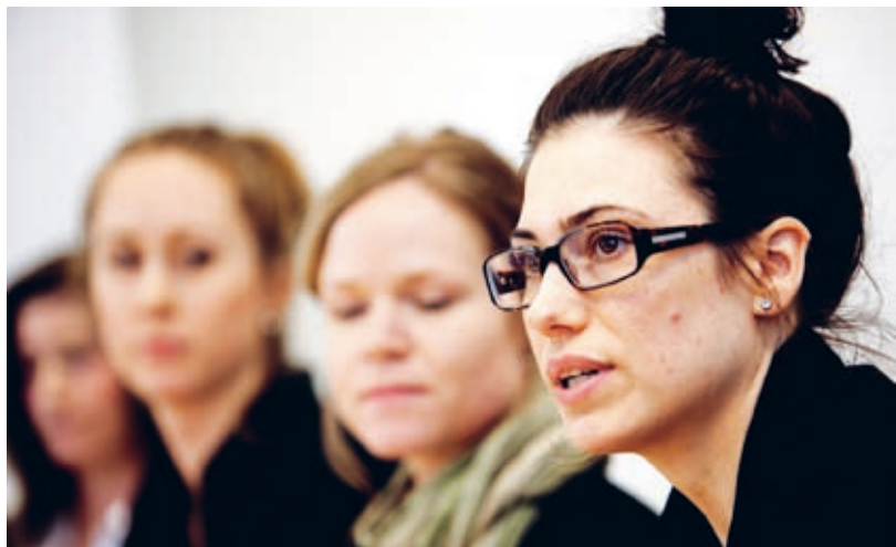
Boom Data har lidit skada av kommunens agerande, menar studenterna.

Fördjupningskursen i offentlig upphandling sker i samarbete mellan Göteborgs universitets upphandlingsenhet, Lindahls Advokatbyrå, stadskansliet på Göteborgs Stad och Göteborgs Stads upphandlingsbolag. Kursen består både av individuella moment och gruppövningar, som rollspel. Utbildningen ska också fungera som en plattform för forskning inom offentlig upphandling.