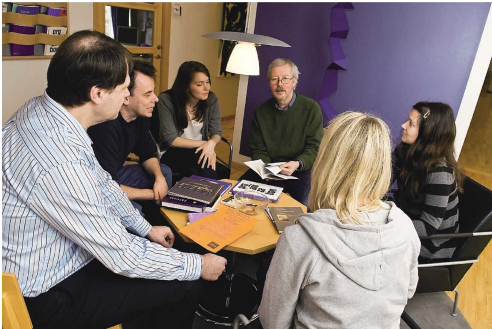
En kreativ forskarmiljö kännetecknas av ett öppet, respektfullt gruppklimat med god atmosfär samt ett ledarskap som stöttar och kan ge feedback på idéer, menar Sven Hemlin som nyligen utkommit med boken Kreativa kunskapsmiljöer i bioteknik .