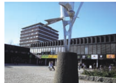
Oslo universitet grundades 1831 och kan stoltsera med fyra Nobelpristagare.

– Jag vågar påstå att studenterna här får mer tid, bättre examinationer och framför allt större rättssäkerhet. När det gäller