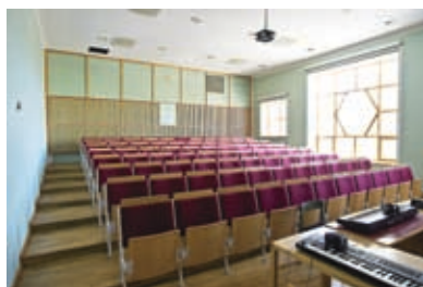
Föreläsningssalen på Artisten har en beläggning på 33 procent, visar studien.

– En del föreläsningssalar kan säkert byggas om till kontorslokaler. Men vi är inte så pigga på att föra över allt till