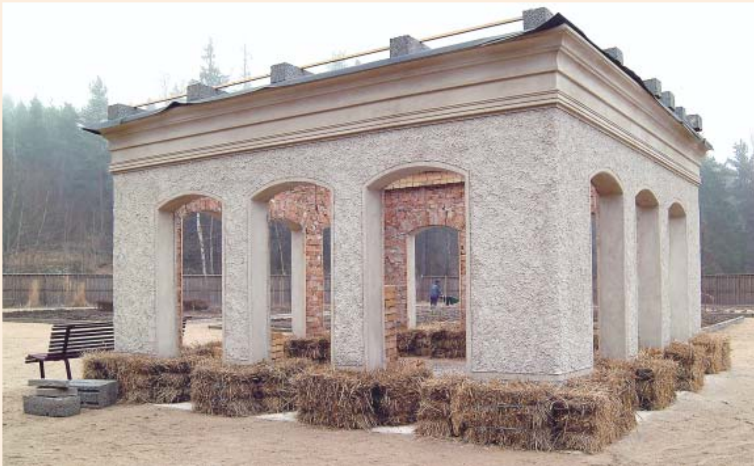
Överallt finns spår från tidigare elevers arbeten. Den murade paviljongen har blivit ett attraktivt besöksmål.