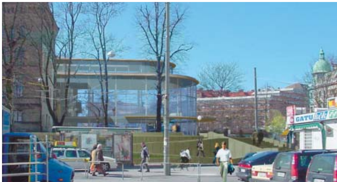
FOTOMONTAGE: NIRENS ARKITEKTONTER AB

Är du intresserad av att snabbt få information om vad som händer vid GU? Tag då som vana att varje morgon titta in på www.gu.se/aktuellt/ Där presenteras nyheter, både interna och externa, och där kan man också rösta i Veckans fråga. Eller gå in på Fria Ord och tyck till! Webben är till för dig!