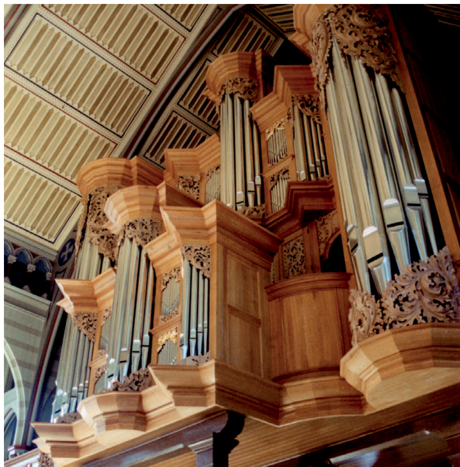
GOArt byggde den nordtyska barockorgeln i Örgryte nya kyrka som invigdes 2000 efter fem års arbete och en kostnad på 35 miljoner kronor.

– Alla institutioner gör av och till negativa resultat. Dock har de ett anslag som kan användas att balansera dessa. Det vi behöver