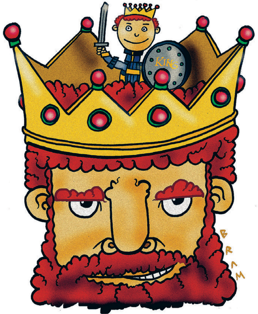
ILLUSTRATION: MARIO BRANGLIONI

- OCKSÅ DETTA SYSTEM ledde till blodiga rivaliteter, förklarar Anders Sundell. Många krig i Europa har handlat om hur en komplicerad arvslagstiftning ska tolkas, exempelvis Vilhelm Erövrarens invasion av England 1066, hundraårskriget mellan