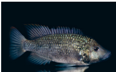
Nere i källaren på Zoologen finns både stora akvarier med rötsimpa, regnbåge och röding, och mindre akvarier med små guppier.