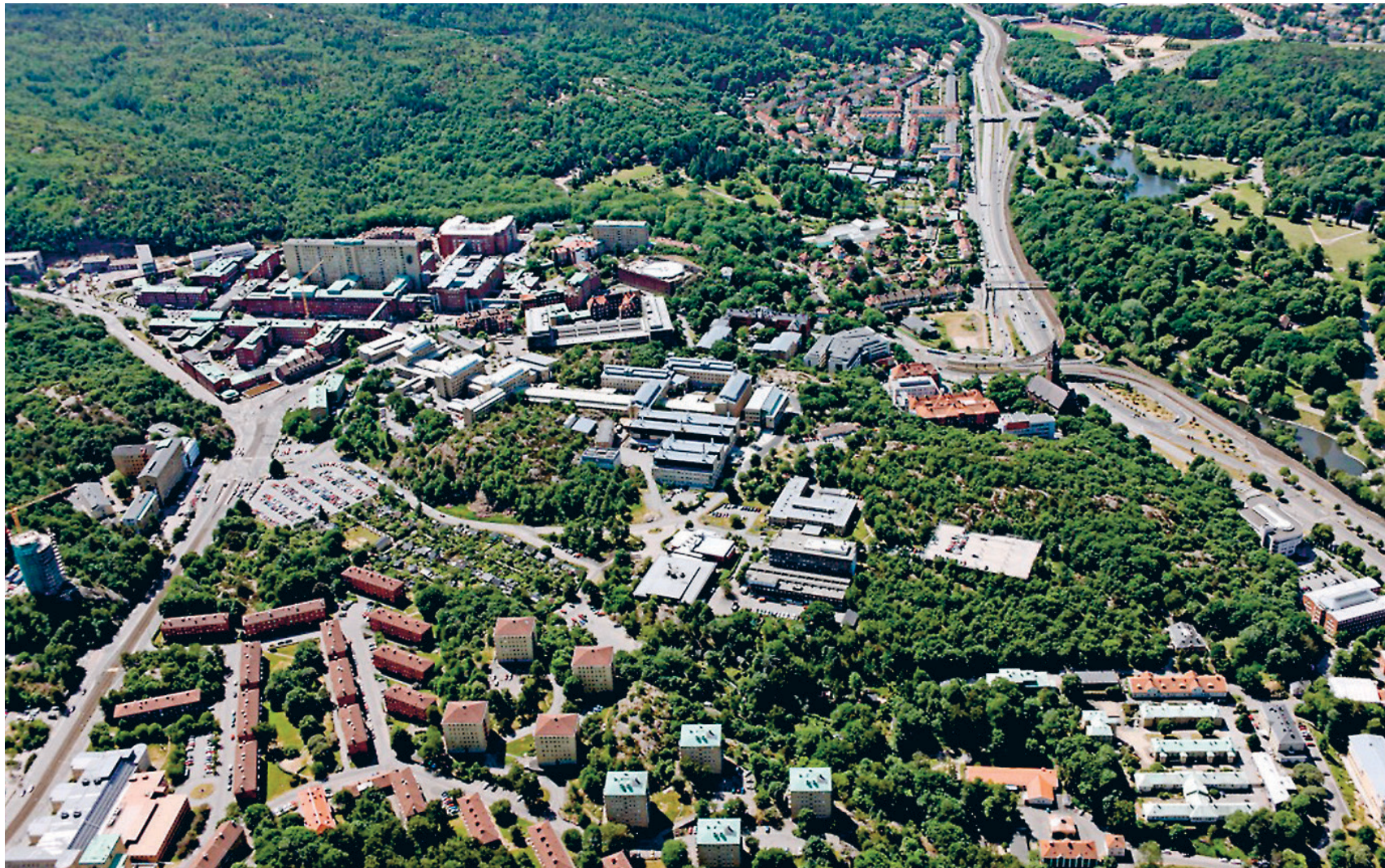
Vision 2020 – Medicinareberget går ut på att knyta ihop Medicinareberget med Linnéplatsen och Sahlgrenska Universitetssjukhuset.