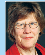
Agnes Wold Läkare och professor i klinisk bakteriologi

- GU BÖR INTE gå med vinst. Kombinationen av överskott och höga OH-kostnader är oroväckande. Överskottet borde plöjas ner i verksamheten, till exempel i förbättrad kvalitet i undervisning eller lektorers forskningstid i tjänst. Många välskötta institutioner går idag med underskott på grund av ökade lokalkostnader och "stöd"-kostnader.