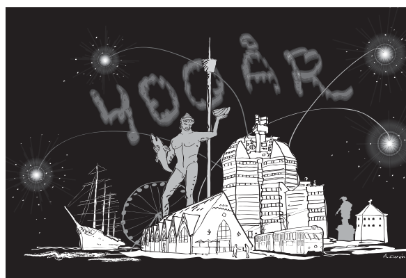
ILLUSTRATION: ANDERS EURÉN

– Bland våra 16 000 medarbetare är åtminstone 10 000 högskoleutbildade. Hos oss pågår en stän-