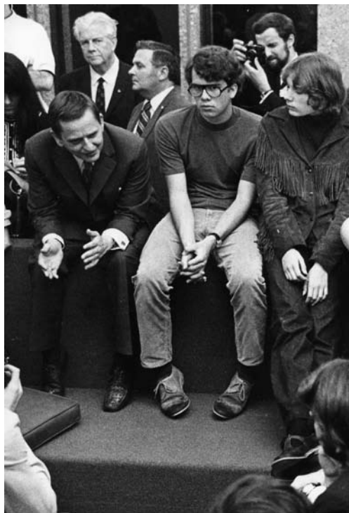
Olof Palme samtalar med studenter vid ett amerikanskt universitet på 1970-talet.

Du verkade oövervinnelig. Gud, vad full av hopp du var! Du lät så säker på att människorna kunde samarbeta för att skapa en värld där välstånd och omtanke kom alla till del.