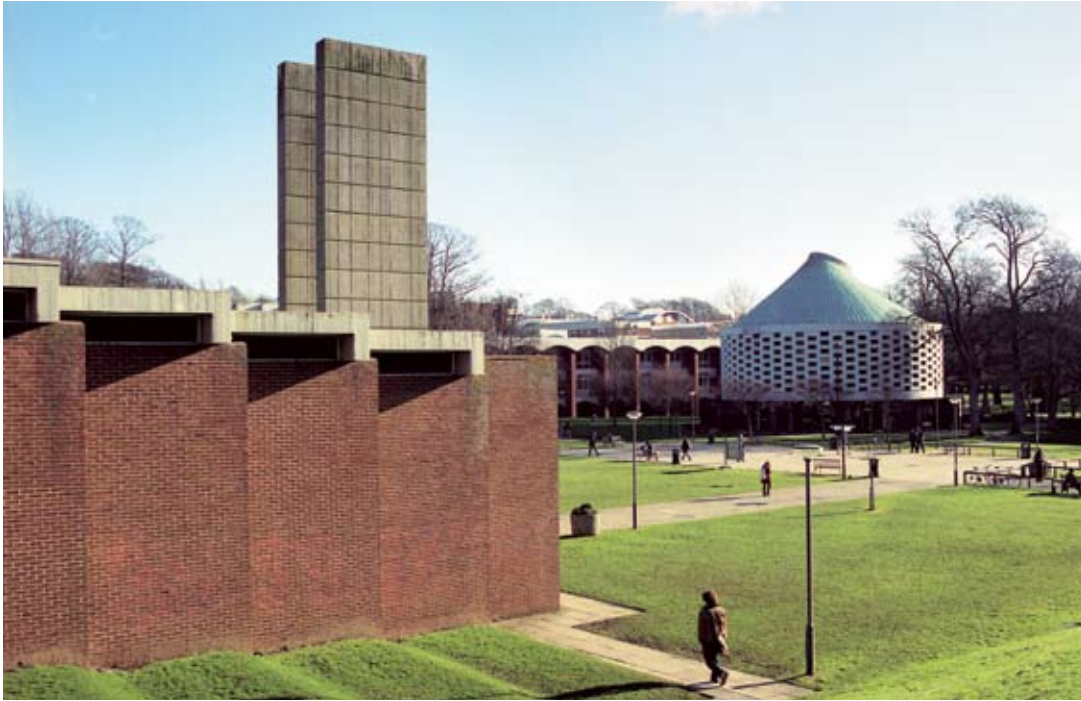
University of Sussex: Den runda byggnaden är samlingslokal.

Studenterna lär sig hur det är att leva i en annan kultur, men de lär sig också att se på Sverige och sig själva med andra ögon. Det är inte samma person som kommer hit och som sedan reser hem igen.