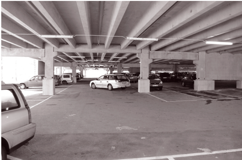
Det finns gott om lediga platser vid GU:s nya p-däck på Medicinareberget.

Den 1 december 2003 höjdes parkeringstaxan på Medicinareberget från åtta till tolv kronor om dagen. En ytterligare höjning var att vänta vid årsskiftet då taxan för 2004, enligt förslag, skulle uppgå till