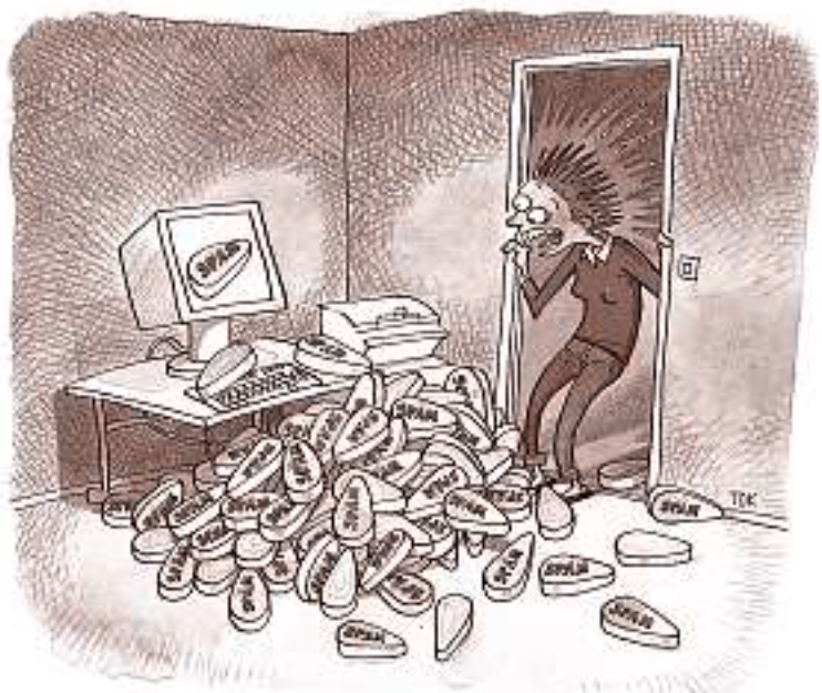
ILLUSTRATION: TOMAS KARLSSON

Spam är egentligen en sorts amerikanskt konserverat kött, men ordet har hamnat i Internet-vokabulären tack vare en sketch i den brittiska komediserien Monty Python. En gäst går in på ett café och frågar efter något att äta, men det enda som finns på menyn är olika former av spam. Spam får alltså symbolisera något oövertygligt som man verkligen inte vill ha.