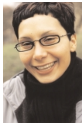
POLY Ordförande för Göteborgs universitets studentkårer (GUS), id Studentkommittén

Titlar i all ära, de titlar som jag är mest stolt över är mamma och student. De två orden säger mer om mig som person än alla andra av mig ovannämnda titlar.