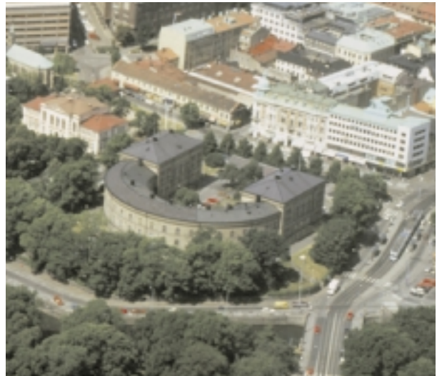
Här vid Sociala huset är det tänkt att nya Pedagoggen skall ligga.

Dessutom antyder de åtta politiker-na att flertalet lärare på Pedagoggen inte är "särskilt förtjusta i flytten"