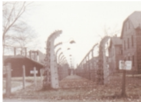
Den 27 januari är officiell svensk och europeisk minnesdag för Förintelsen. Bilden visar förintelselägret Auschwitz-Birkenau.

Har du nyhetstips? Händer något intressant på din arbetsplats som tidningen borde skriva om och som har ett allmänintresse för samtliga anställda? Hör av dig till redaktör Allan Eriksson, tel: 773 1021, e-post: gu-journalen@gu.se