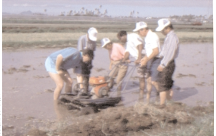
Filippinska risodlare provar nya redskap. Forskning om risodling har lett till högre avkastning och bättre anpassade redskap. Det är en bidragande orsak till att fattigdomen har trängts tillbaka i flera länder i tredje världen.