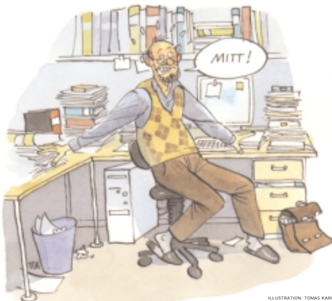
ILLUSTRATION: TOMAS KARLSSON

Undersökningen visar bl a att närmare hälften av de undersökta institutionerna inte har någon regelrätt registrering av de formella handlingarna. Det är vanligt att ansökningar om forskningsmedel inte diarieförs. Ofta saknas rutiner. När sådana finns skiljer de sig från institution till institution, men även från forskare till forskare.