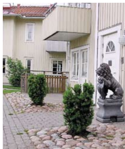
Helenebergsgatan 14 tvåor