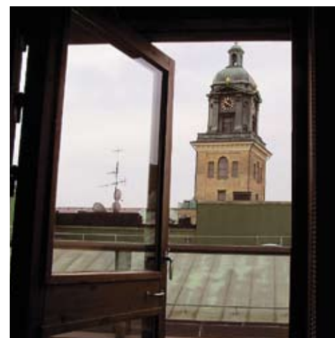
Drottninggatan Gästväningen på Drottninggatan, Royal Society, är en gåva till universitetet från Kungliga Vetenskaps- och Vitterhetssamhället i Göteborg. En lägenhet på tre rum och kök.