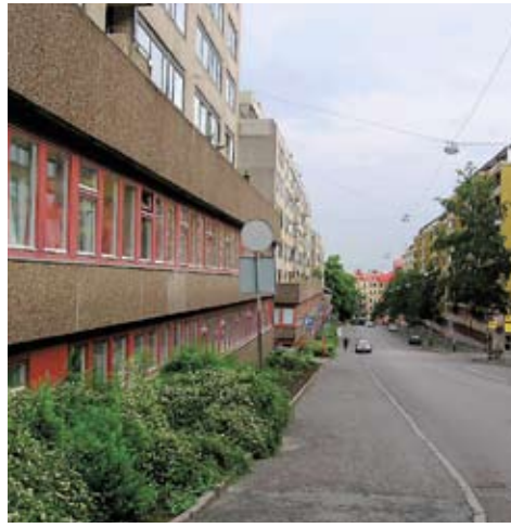
Vegatan 30 enkelrum med gemensamt kök och sällsapsrum med TV.