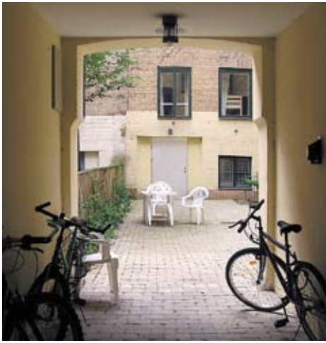
Storgatan 20 lägenheter av varierande storlek (9 ettor, 7 tvåor och 4 treor).