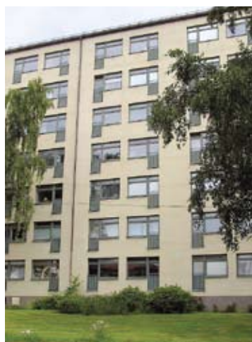
Guldhedstorget 3 lägenheter (1 etta och 2 tvåor)