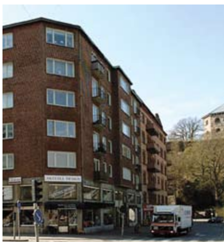
Skanstorget 4 lägenheter (2 ettor och 2 tvåor)