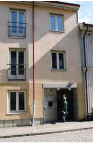
Haga 10 enkelrum med gemensamt vardagsrum och kök.

Förmedling av gästforskarbostäder och bostäder för utbytesstudenter sköts av ett KI-bolag som heter University Accommodation Center (UAC). Det finns ett samarbetsavtal mellan lärosätena. Totalt finns 200–250 rum och lägenheter för gästforskare, varav de flesta ligger centralt i Stockholm. Snittpriset (inklusive påslag) för ett rum ligger på 3 000 kronor och cirka 7 000 kronor för två rum och kök, beroende på storlek och läge. Beläggningen är mycket god. Verksamheten subventioneras till viss del genom donationsmedel.