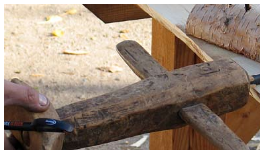
Snickeriverkstad vid hantverksskolan Da Capo i Mariestad. Där lär sig studenterna bland annat att tillverka så kallade navare, borrar som användes för 1000 år sedan.