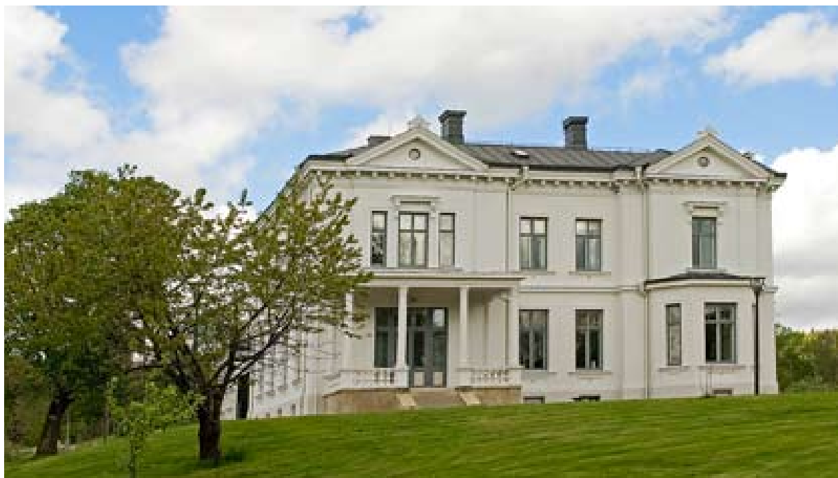
Framtiden för Jonsereds herrgård är tryggad i och med att Partillebo AB tar över driften av huset.

ska ta över Jonsereds herrgård är att universitetet kommer överens med Wallenstam och att det nya hyreskontraktet skrivs på först när kommunens ledning har godkänt affären.