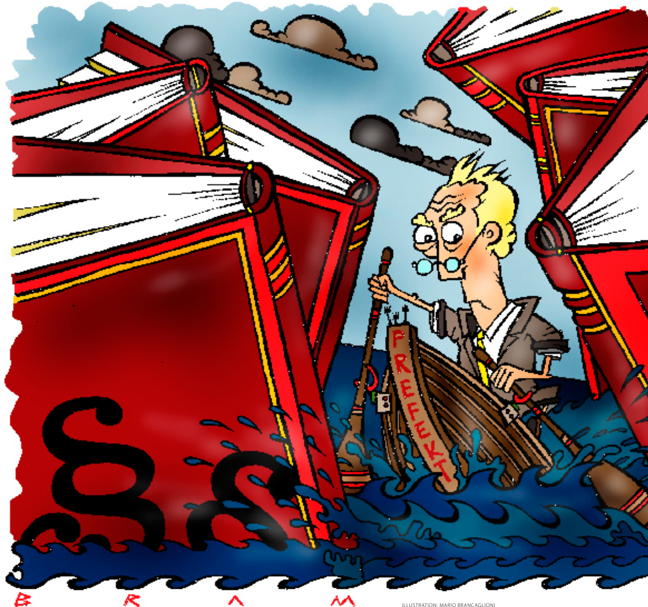
ILLUSTRATION: MARIO BRANCAGLIONI