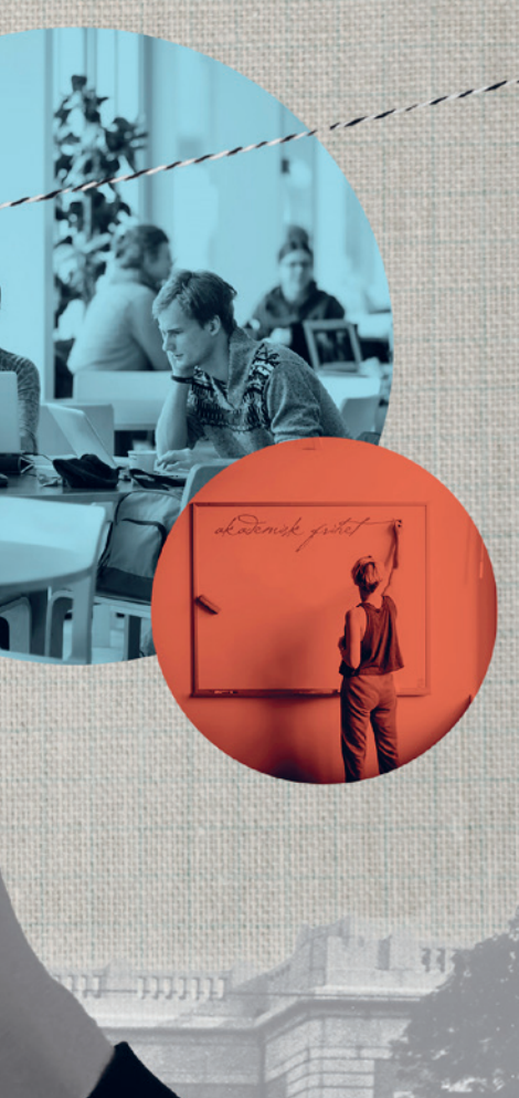
Illustration: LARS LANHED

från tidigare regeringar, säger Åsa Wikforss.