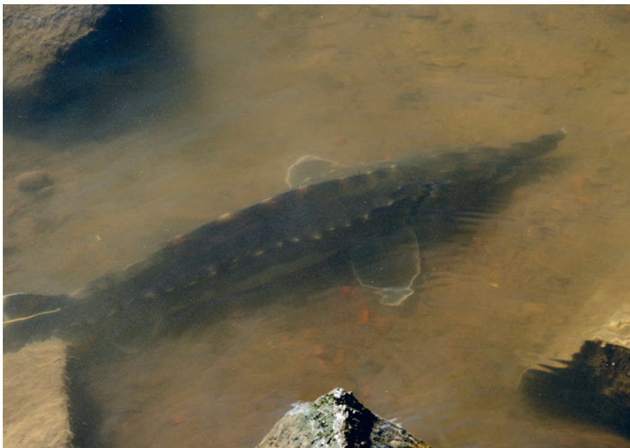
Atlantstörarna var 10 månader gamla och cirka en halvmeter långa när de släpptes ut i somras.

Göteborgsoperan. En fisk hittades död utanför Marstrand. Den 28 augusti fångades en stör i Langesund som sedan släpptes ut - på en dryg månad hade den alltså simmat en imponerande sträcka ända upp till Norge!