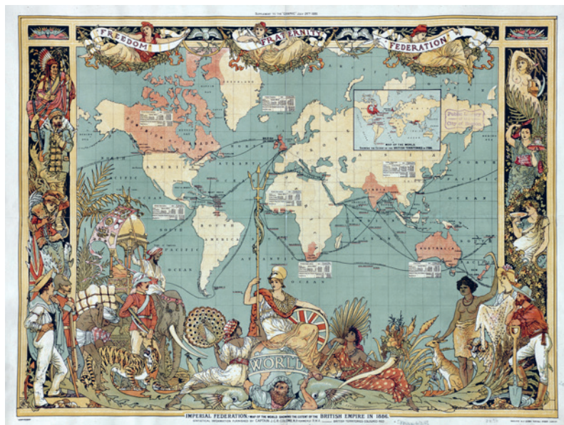
Kartan, skapad av J C R Colomb, visar det brittiska imperiet 1886.

– I samband med hotet från ett nytt krig skapades 1939 ytterligare en organisation, the Federal Union , som tänkte sig