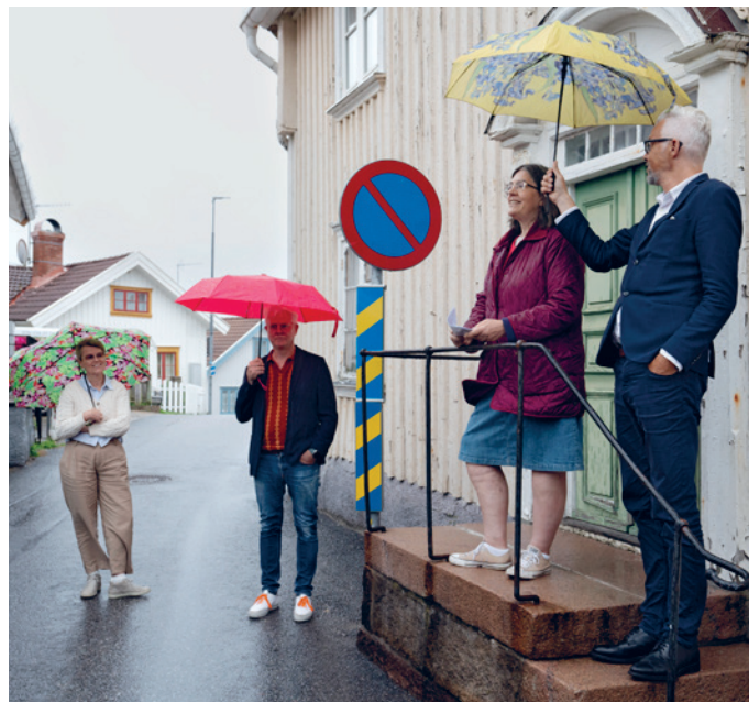
I Fjällbacka berättade Ulla Åkerström om den bortglömda författaren Hilma Angered-Strandberg.

än hon väntat: Fjällbackaborna ansåg sig förlöjligade och efter publiceringen var hon inte längre välkommen hos dem.