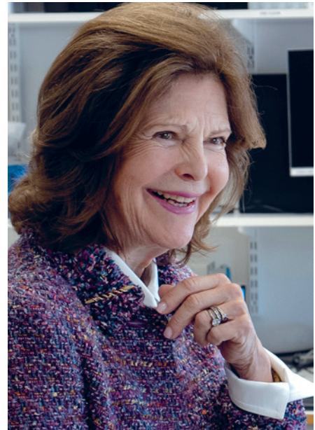
Drottning Silvia kommer att närvara.

- Bland annat kommer Wellcome Trust att delta, liksom flera internationella experter samt framstående forskare från