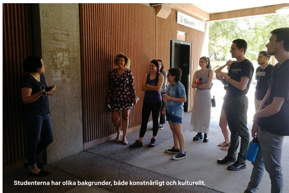
Studenterna har olika bakgrunder, både konstnärligt och kulturellt.

Att skapa en känsla av gemenskap är betydligt viktigare i USA än i Sverige.