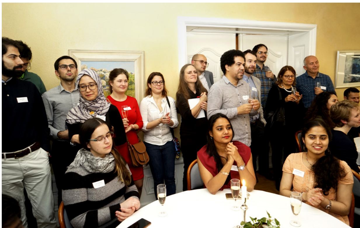
Welcome services arrangerar en internationell kväll varje termin.