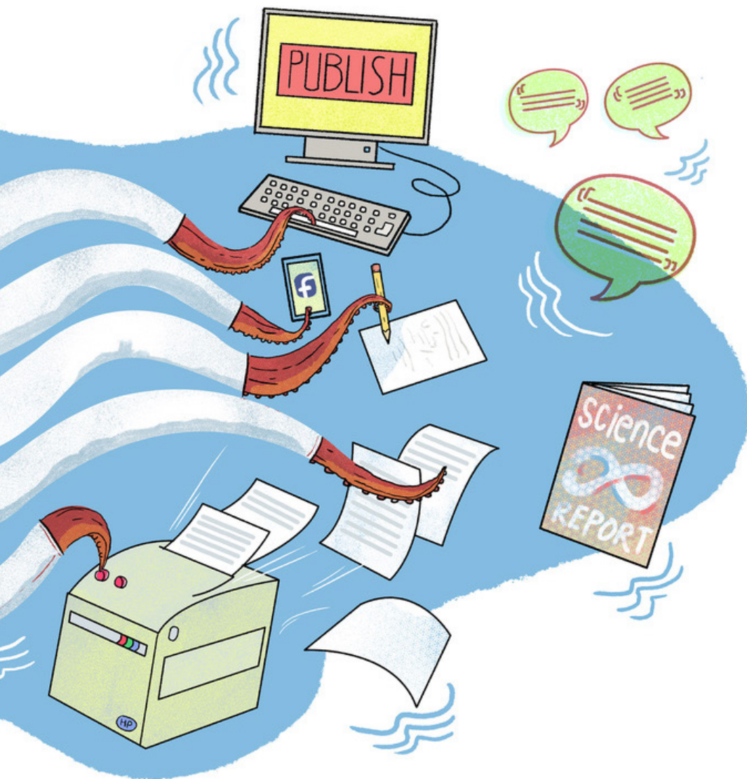
Illustration: MARIA KÄLLSTRÖM

sjukdomar. Flera av artiklarna är samförfattade.