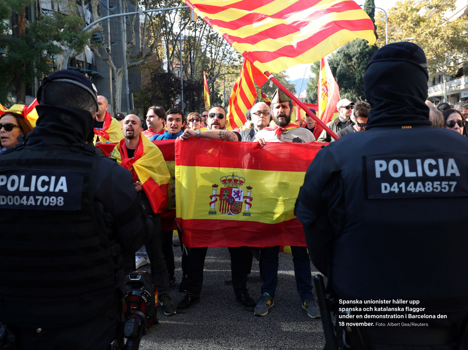
Spanska unionister håller upp spanska och katalanska flaggor under en demonstration i Barcelona den 18 november.