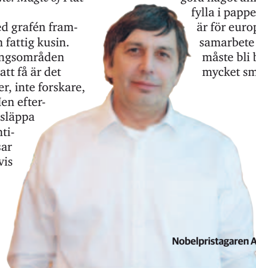
Nobelpristagaren Andre Geim

– Den väldiga byråkratien för tankarna till Kafka, man hinner knapp göra något annat än fylla i papper. Jag är för europeiskt samarbete men det måste bli betydligt mycket smidigare.