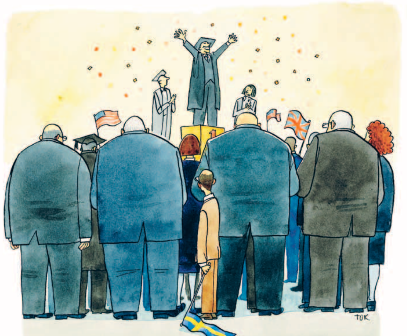
ILLUSTRATION: TOMAS KARLSSON