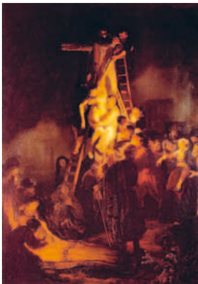
Nedtagningen från korset av Rembrandt van Rijn, 1634, Erimitaget, S:t Petersburg.