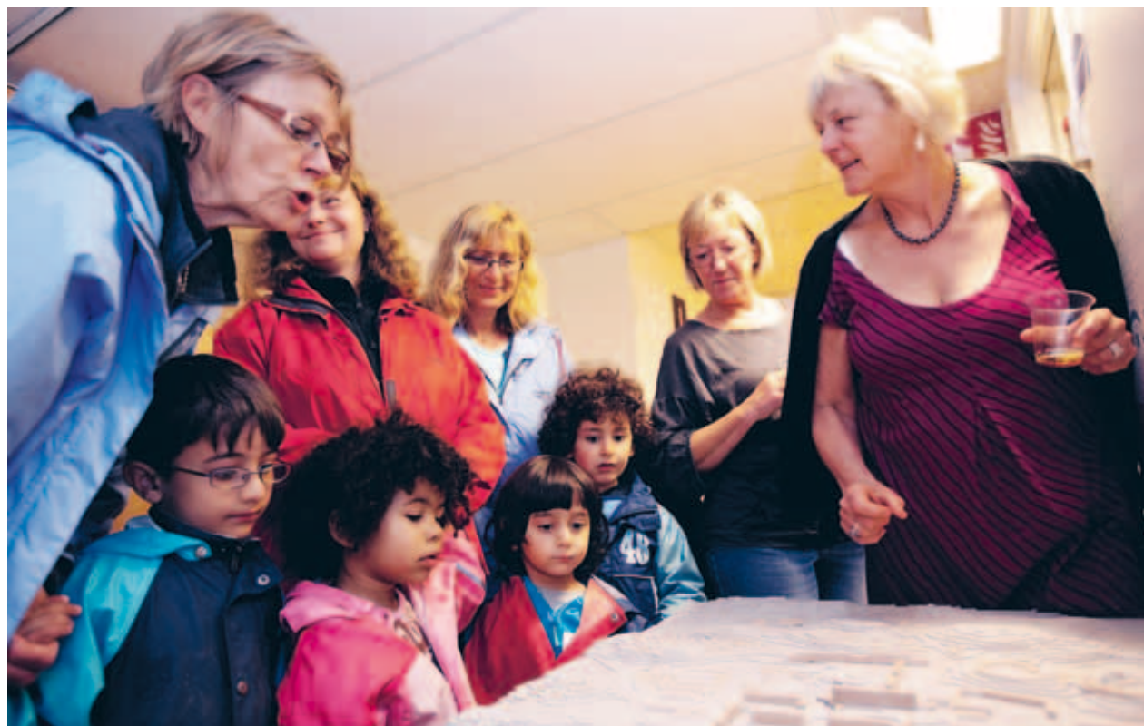
Boende i Hammarkullen ska komma närmare universitetet.

Den 11 juni invigdes Centrum för urbana studier i Hammarkullen, ett samarbete mellan Göteborgs universitet och Chalmers.