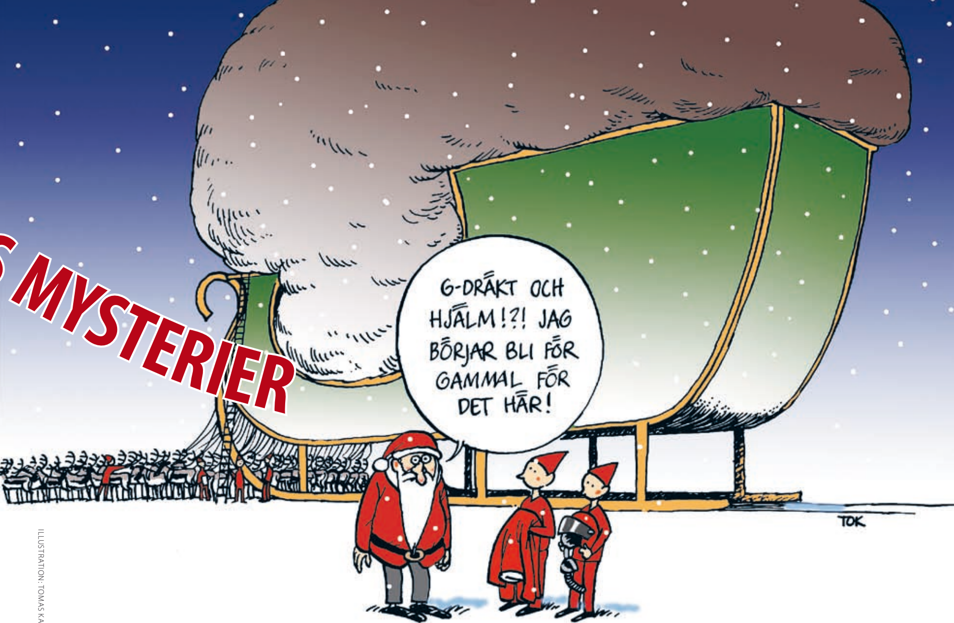
ILLUSTRATION: TOMAS KARLSSON